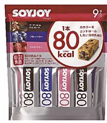
○ソイジョイカロリーコントロール80 (9本)