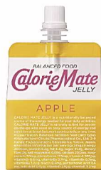
○カリメイトゼリー (6袋)